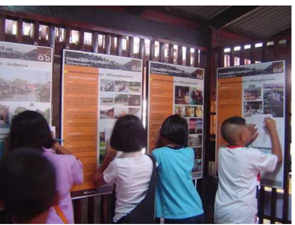
ภาพจากกิจกรรม “ค่ายสิ่งแวดล้อมศิลปกรรม ครั้งที่ 3”